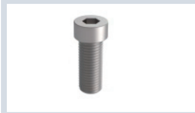
■短头小径内六角圆柱头螺钉