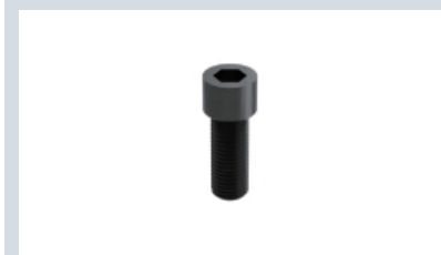
■小径内六角圆柱头螺钉