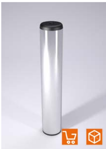
Esempio di montaggio