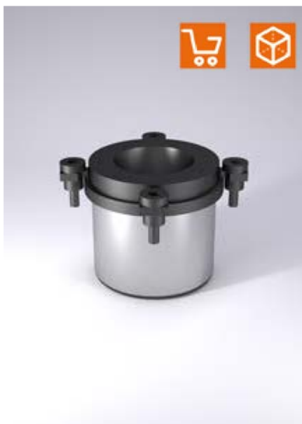
Esempio di montaggio