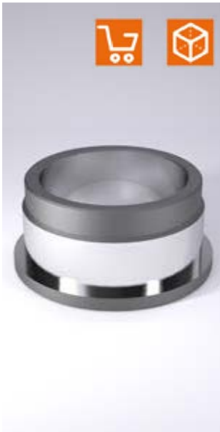
Ejemplo de montaje