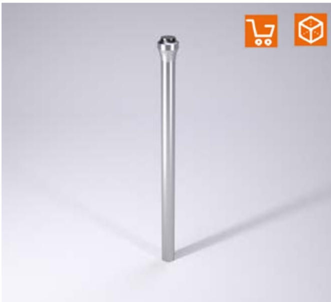
2284.3. Punzón de corte con cabeza en forma de trombón, DIN 5118 Forma A