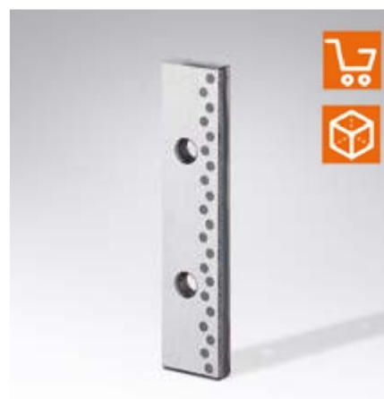
2961.81. Listello di scorrimento per chiusura di movimenti, Acciaio con inserti di lubrificante solido, VDI 3357