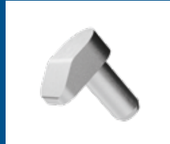
Bolzen und Hülsen