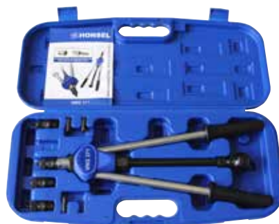
Lieferung im schlagfesten Kunststoff-Koffer.