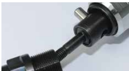
Schnellwechselsystem für Gewindedorn.

Komfortables Abspindeln durch leichtgängigen Drillstab