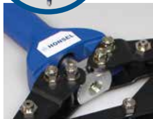
Wechselmundstücke im Werkzeug verschraubt.