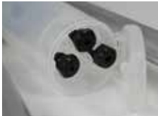
Wechselmundstücke in verschlossenem Fach am Stiftaufangbehälter