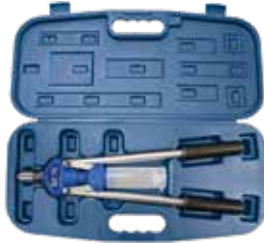
Hebelnietgerät BZ 70 im schlagfesten Kunststoff-Koffer.