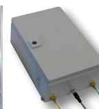
Steuerbox Anwesenheitskontrolle (SPZ.Awk)

Hydraulisch betätigt: Kraft-Diagramm 10...120 bar (Druck oder Zug; passendes Hydraulikaggregat S. 71)